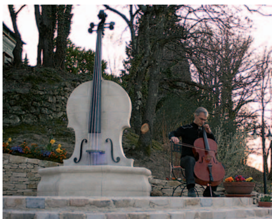
L'inauguration a eu lieu le 21 mars 2009 en présence du célèbre violoncelliste-compositeur américain Eric Longfworth.