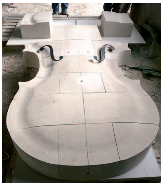
Différentes étapes de la conception à la réalisation et la pose de la fontaine en Roche d'Espeil.